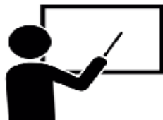
全牆面玻璃大白版